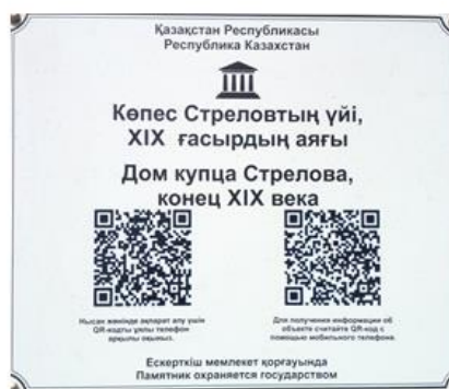
Рисонок 5. Проект «Заман таспасы»

85 объектов оснащены охранными табличками с QR-кодом.