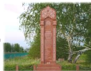
Рисунок 3. Сакральные объекты общенационального значения

Создана интерактивная карта исторических и сакральных мест, достопримечательностей края, объектов туристского интереса, природных заповедников. Карта размещена на портале Управления культуры. Карта позволяет просмотреть краткую информацию, фото и видео об объекте.