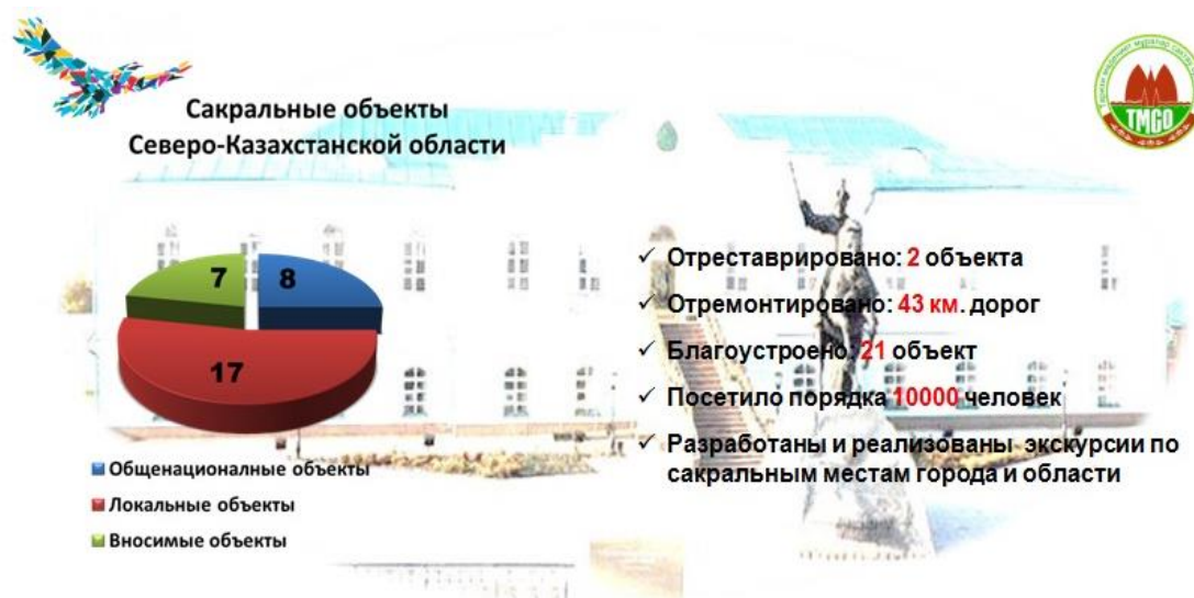
Рисунок 1. Статистика сакральных объектов Северо-Казахстанской области.

27 марта этого года Рабочей группой было рассмотрено и рекомендовано к включению в Сакральную карту области еще 7 памятников архитектуры и природного значения.