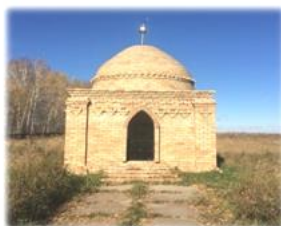
Мазар Ноғайбай би