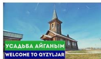
Рисонок 4. Интерактивная карта «Сакральные места Северо-Казахстанской области»

В 2017 году был инициирован проект «Заман таспасы». Проект предполагает собой установление охранных табличек с QR-кодом. На сегодняшний день установлено более 80 табличек.