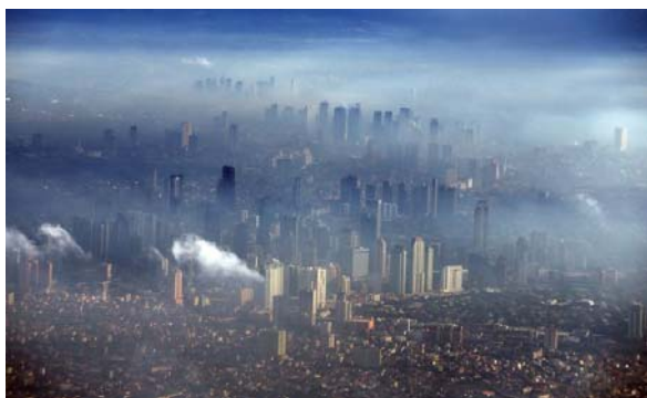
Ал бұл вирусқа дейінгі сурет:

Келесі ол- Италия. Көптеген ғалымдар Италия коронавирустың таралуының жаңа ошағына айналғанын айтады. Ауруханаларда жүздеген дәрігерлер адамдардың өмірі үшін күресіп, ауруды жеңуге тырысады. Алайда, бұл жерде де вирус экологияға өзіндік түзетулер енгізді. Венецияда көп жылдар бойы алғаш рет каналдардағы су мөлдір болды. Оларда балық пен ақ