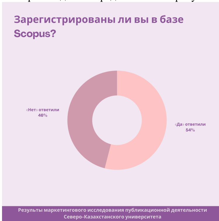
Рис.9. Ответы респондентов на вопрос о регистрации в базе Scopus.

Визуально ответы респондентов представлены на рисунке 9.