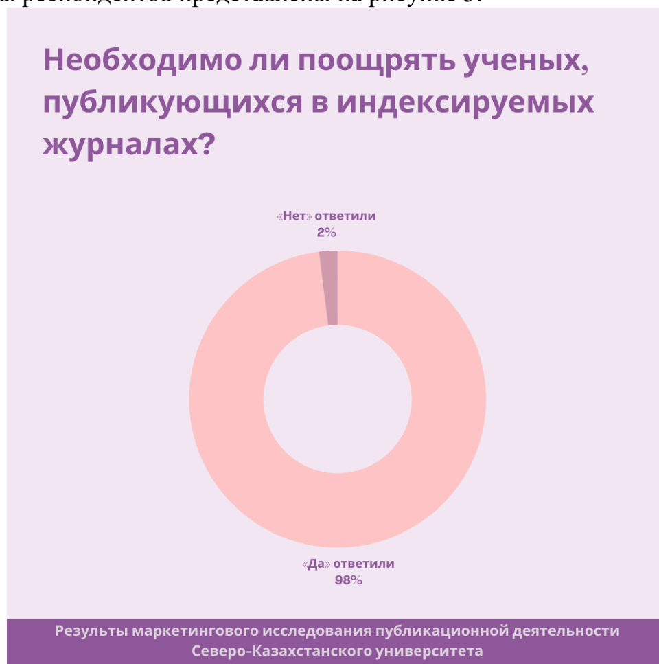
Рис.5. Ответы респондентов на вопрос о поощрении за публикации

Ответы респондентов представлены на рисунке 5.