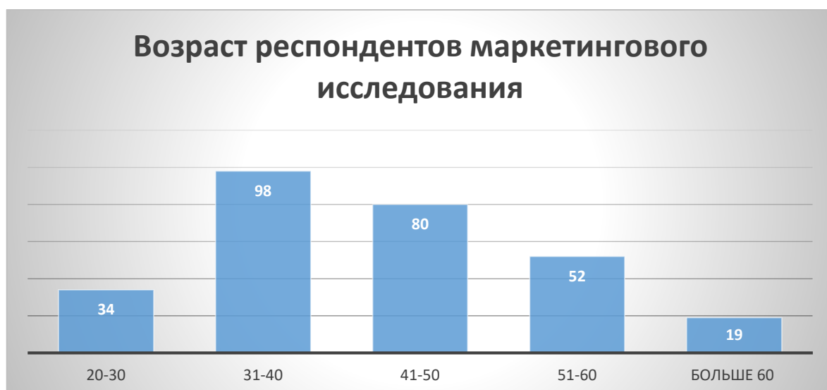
Рис.1. Распределение респондентов маркетингового исследования по возрасту

Более наглядно распределение респондентов по возрасту представлено на рисунке 1.