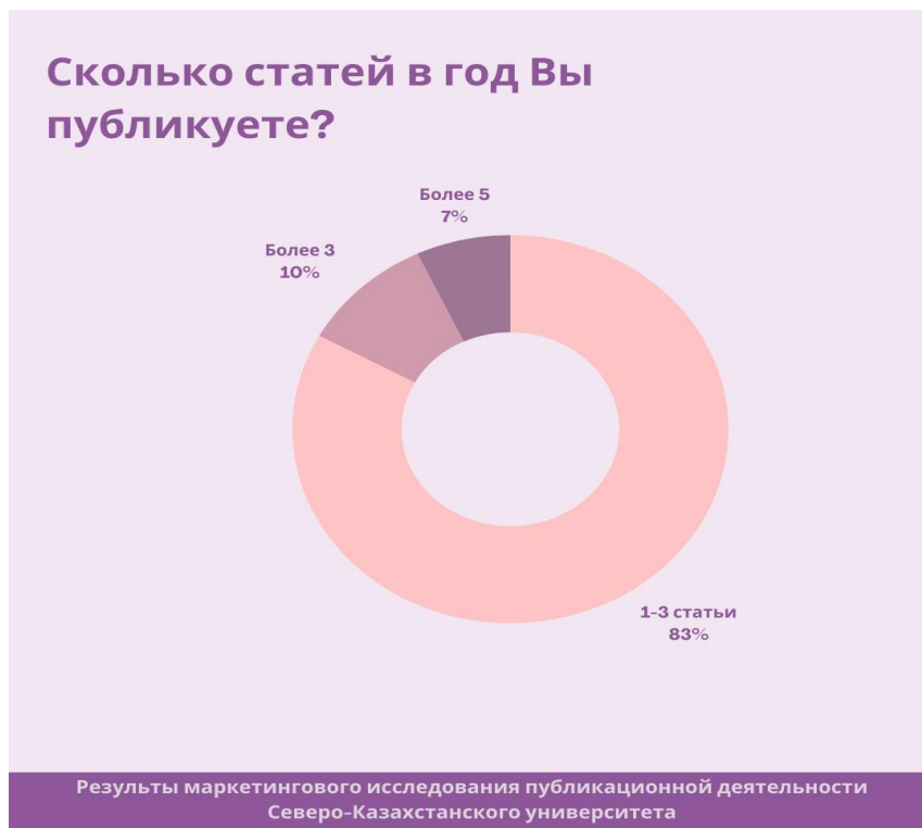
Рис.3. Ответы респондентов на вопрос о количестве публикаций в год

Данные ответы говорят о низкой публикационной активности с учетом того, что основная масса статей публикуется в неиндексируемых сборниках конференций.