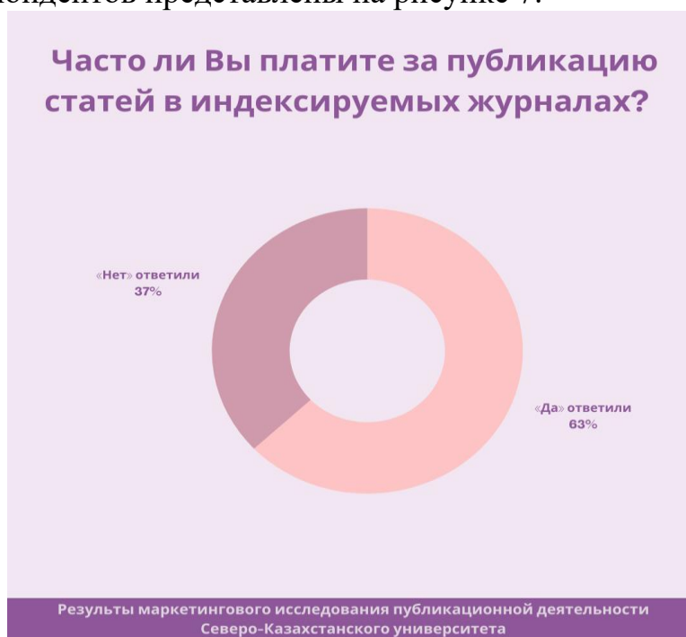
Рис.7. Ответы респондентов на вопрос об оплате за статьи в рецензируемых журналах

Ответы респондентов представлены на рисунке 7.