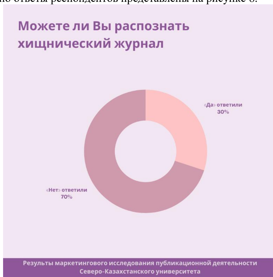
Рис.8. Ответы респондентов на вопрос о хищнических журналах

Визуально ответы респондентов представлены на рисунке 8.