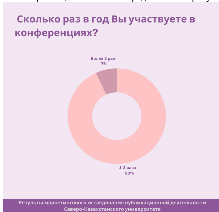
Рис.4. Ответы респондентов на вопрос об участии в конференциях в год

Визуально ответы респондентов можно представить на рисунке 4.