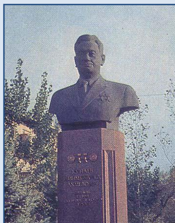
Бюст Первого секретаря ЦК Компартии Казахстана Д.А. Кунаева.