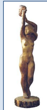
Вестница. 1976 г.