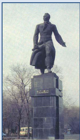
Памятник Алиби Джангильдину. 1975 г.

Основные работы. Памятники Чокану Валиханову (Кокчетав, Алматы), Алиби Джангильдину, Гани Муратбаеву, Мухтару Ауэзову (Алматы). Скульптурные портреты «Восточная голова» (1968), «Портрет Олжаса Сулейменова», «Портрет Бибигуль Тулегеновой», «Планы республики» (портрет Динмухамеда Кунаева), «Портрет поэта» (1979), «Портрет Б.А. Беримжанова» (1981), «Портрет профессора С.А. Вольмира» (1981).